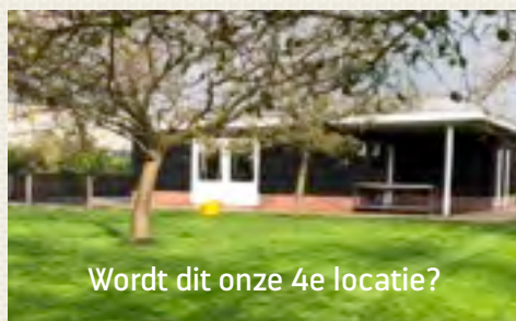
Wordt dit onze 4e locatie?

Onvergetelijk Leven groeit! Onze visie, methode, persoonlijke aanpak en locaties spreken steeds meer mantelzorgers en zorgprofessionals aan. Gevolg is dat we zoveel vraag krijgen dat we uit ons jasje groeien. Omdat we elke cliënt die aandacht en passende zorg willen (blijven) geven die hij of zij nodig heeft én in een rustige en huiselijke omgeving, hebben we besloten op zoek te gaan naar 'n 4e locatie binnen ons zorggebied Stichtse Vecht en Vleuten de Meern.